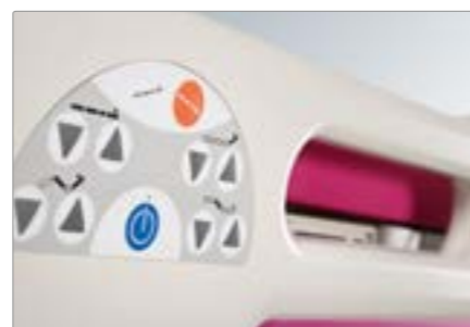
Панели управления в боковых ограждениях