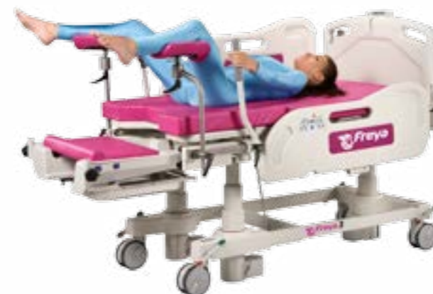
Горизонтальное положение с матрасом для новорожденного