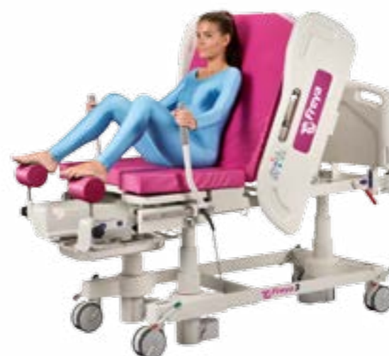
Сидячее положение (с опущенными боковыми ограждениями)