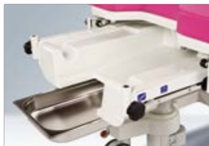
Выдвигаемый съемный лоток для физиологических жидкостей