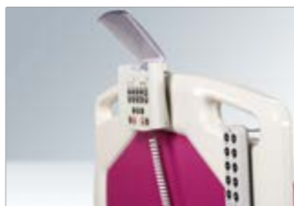
Центральная панель управления и проводной пульт управления