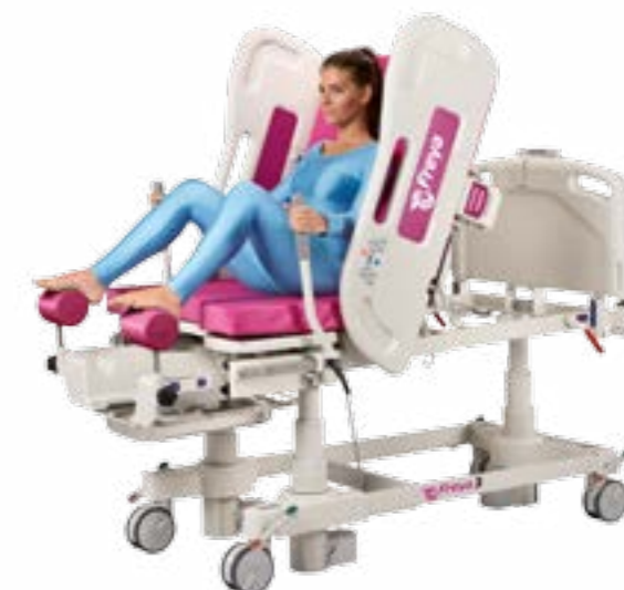
Сидячее положение (с поднятыми боковыми ограждениями)