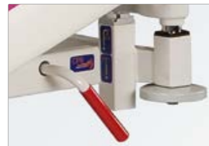
Рычаг быстрой разблокировки спинной секции (CPR)