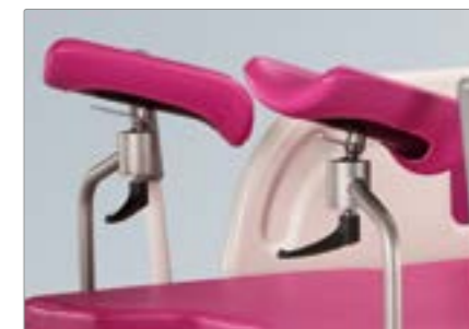
Опоры для колен