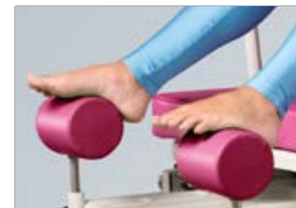
Опоры для ног