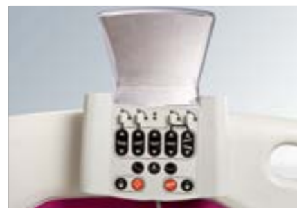
Центральная панель управления (supervisor)