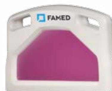
Торцы пластиковые цвета RAL 9002 с вставками