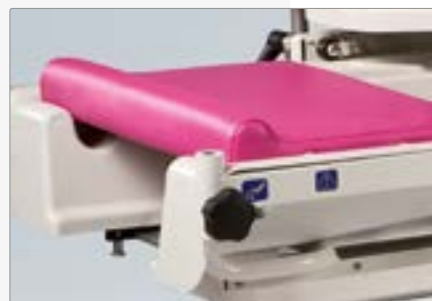
Матрац для новорожденного