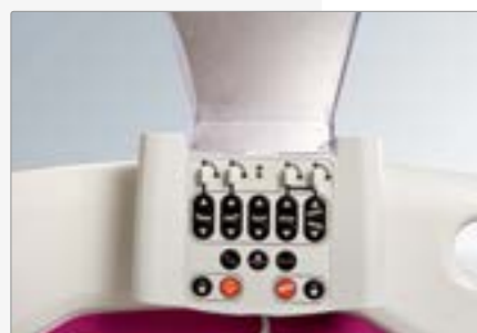
Центральная панель управления (supervisor)