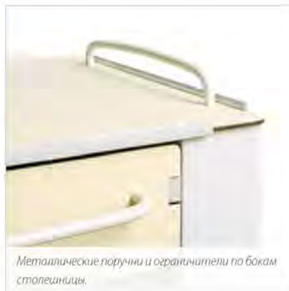
Металлические поручни и ограничители по бокам столешницы.