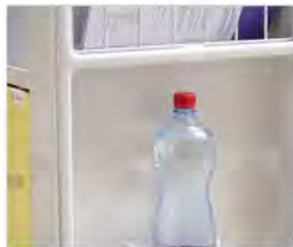
Возможность использования держателя бутылок и журналов (стандарт).